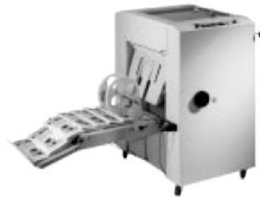
FOLDNAK 8 Afmetingen / Dimensions : H/H 870 x B/L 610 x D/P 560 (1270 mm)