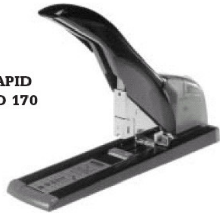
RAPID HD 170